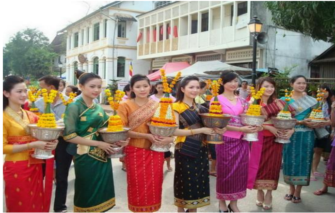
( ການນຸ່ງຫົ່ມເພດຍິງ )

- ອາຍຸ 50 ປີລົງມາ ນຸ່ງສິ້ນຝ້າຍ ຫຼື ສິ້ນໄໝ ມີຫົວມິຕິນ, ນຸ່ງເສື້ອແຂນຖ່ອງສີຂາວ, ສີເຫຼືອງອ່ອນ, ສີ ລາຍລຽບ.