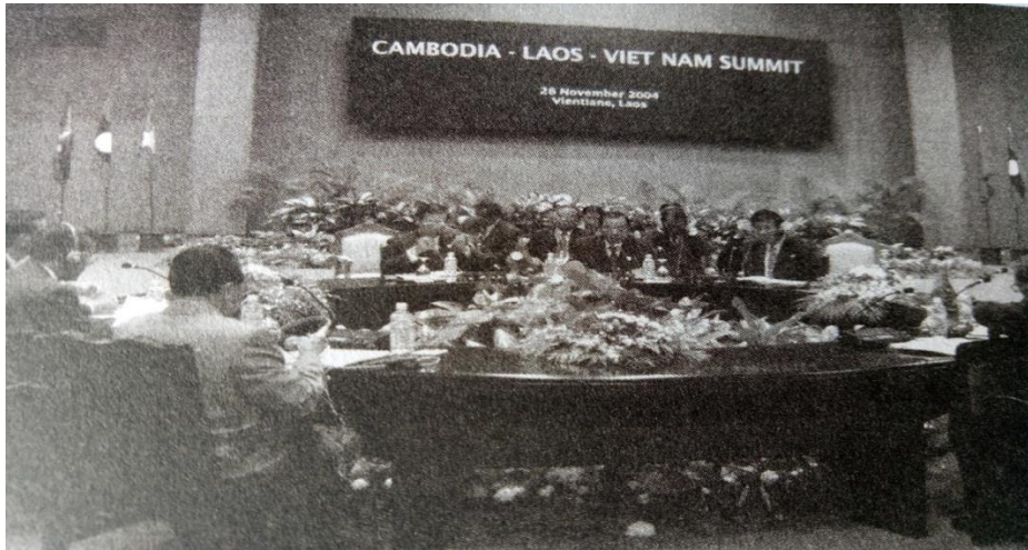
(ຮູບ ກອງປະຊຸມສຸດຍອດ ກຳປູເຈຍ, ລາວ, ມຽນມາ ແລະ ຫວຽດນາມ)

ບັນດາຜູ້ນຳໄດ້ລົງນາມໃນຖະແຫຼງການວຽງຈັນວ່າ ດ້ວຍການເສີມຂະຫຍາຍການຮ່ວມມື ແລະ ການເຊື່ອມໂຍງທາງດ້ານເສດຖະກິດຂອງ 4 ປະເທດ. ຖະແຫຼງການດັ່ງກ່າວ ໄດ້ໃຊ້ເປັນທິດຊີ້ນຳໃນການ ເພີ່ມທະວີການປະສານງານ ແລະ ການຊ່ວຍເຫຼືອເຊິ່ງກັນແລະກັນ ລະຫວ່າງບັນດາປະເທດ ກຳປູເຈຍ, ລາວ, ມຽນມາ ແລະ ຫວຽດນາມ, ເສີມຂະຫຍາຍການຮ່ວມມືລະຫວ່າງປະເທດ ໃນຂົງເຂດທີ່ທຸກຝ່າຍຈະໄດ້ຮັບ ຜົນປະໂຫຍດ.