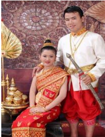
(ການນຸ່ງຫົ່ມໃນຝັ່ງການແຕ່ງດອງ)

ນຸ່ງຜ້າກ່ອມ, ນຸ່ງຜ້າສະໂຫຼ່ງໄໝ, ຝ້າຍ ຫຼື ນຸ່ງໂສ້ງຂາຍາວສີດຳ, ສີຝ້າ, ນຸ່ງເສື້ອຄໍປິດ ຫຼື ຄໍ ເຊີດສີຂາວແຂນສັ້ນ ຫຼື ແຂນຍາວ, ໃສ່ເກີບໂອຊິກ, ຖົງຕີນສີຂາວ ແລະ ແຜປ່ຽງບ້າຍ.