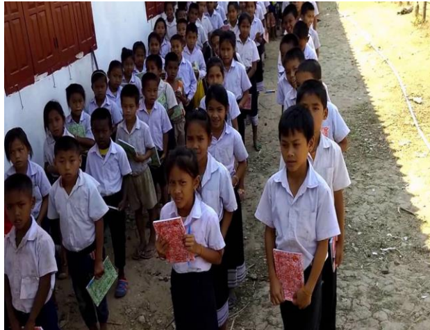
(ຮູບ ການນຸ່ງຫົ່ມຂອງນັກຮຽນຊັ້ນປະຖົມ)