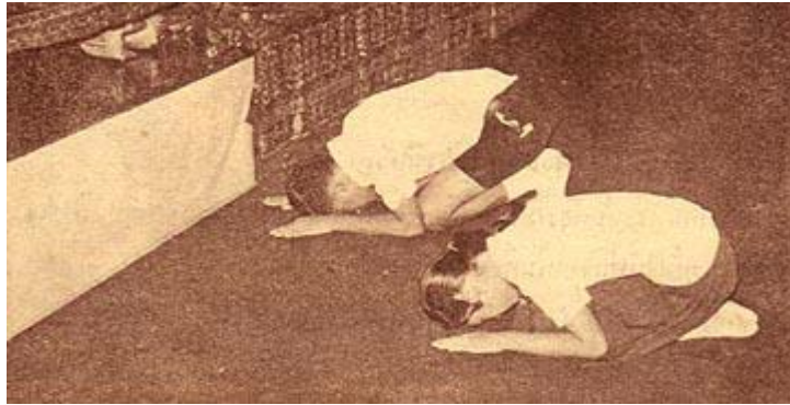
ຮູບພາບໄຫ້ວພະມຸດທະຮູບ ແລະ ພະສິງ

ເມື່ອຂຶ້ນໄປທໍ່ແຈກທີ່ມີພະມຸດທະຮູບ ຕ້ອງຂາບ 3 ຄັ້ງ, ກ່ອນຈະລົງກໍຕ້ອງຂາບລົງ 3 ຄັ້ງອີກ.