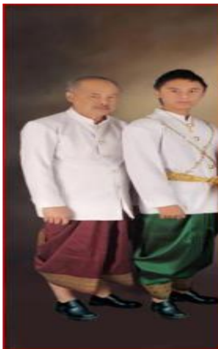
(ການນຸ່ງຫົ່ມຂອງເພດຊາຍ)

ເຖົ້າແກ່ອະວຸໂສ ນຸ່ງຜ້າສະໂຫຼ່ງໄໝ ຫຼື ນຸ່ງໂສ້ງຂາຍາວ, ນຸ່ງເສື້ອແຂນຖ່ອງສີຂາວ ຫຼື ສີລາຍລຽບ, ໃສ່ເກີບຊັ່ງດ່ານ ຫຼື ໂອຊິກ.