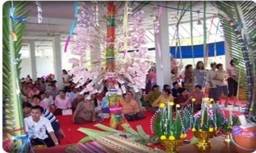
ຮູບພາບບຸນກະຖິນ

ຢູ່ໃນໄລຍະເດືອນສິບສອງນີ້ ນອກຈາກບຸນກະຖິນແລ້ວ ຍັງມີບຸນໄຫ້ວພະທາດອົງສໍາຄັນທີ່ ເປັນ ປູ່ຊະນິຍະສະຖານວັດຖຸບູຮານອັນເກົ່າແກ່, ພະທາດທີ່ໄດ້ເຮັດບຸນສະຫຼອງໃນເດືອນສິບສອງ ເພິ່ງກໍມີພະ ທາດ ຫຼວງວຽງຈັນ, ພະທາດໝາກໂມ ຫຼື ທາດປະທຸມຢູ່ຫຼວງພະບາງ, ພະທາດອີຮັງ, ພະທາດໂພນຢູ່ສະ ຫ້ວນນະເຂດ. ແຕ່ມາເຖິງປັດຈຸບັນ ບຸນໄຫ້ວພະທາດບາງແຫ່ງກໍໄດ້ມີການປ່ຽນແປງ ໄປເຮັດໃນເດືອນ ອື່ນ ແລ້ວກໍມີ ເຊັ່ນ ພະທາດອີຮັງເປັນຕົ້ນ.