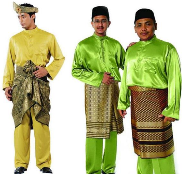
(ຮູບ ຊຸດແຕ່ງກາຍປະເພນີ ຂອງອິນໂດເນເຊຍ)

- ຜູ້ຊາຍ ນຸ່ງໂສ້ງຂາຍາວສີດຳ ຫຼື ສີຕ່າງໆ ເສື້ອຄໍເຊີດສີຕ່າງໆ ໃນພິທີທ່າງການເພດຊາຍຈະນຸ່ງ ຜ້າສະໂຫຼ່ງ ຫຼື ຊຸດເຄນບາຕິກ, ເສື້ອແຈັກເກັດເຄບາຢາ ຕາມດ້ວຍຜ້າຜັນຄໍເຊເລັນດັງ ແຕ່ສຳລັບຄົນໝຸ່ມ ສ່ວນ ຫຼາຍຈະບໍ່ນິຍົມກັນນຸ່ງການແຕ່ງກາຍແບບນີ້ໃນພິທີທ່າງການທີ່ສຳຄັນຕ່າງ ເຊັ່ນ ພິທີແຕ່ງດອງ, ພິທີການ ບຸນວັນຊາດ. ການແຕ່ງກາຍໃນພິທີການແຕ່ງງານເຈົ້າບ່າວໃສ່ຊຸດລິນໂຕບາໂຣ ຄູ່ກັບໂສ້ງຂາຍາວສີດຳຕົກແຕ່ງ ໃຫ້ເຂົ້າກັບຜ້າມັດແອວ ເກນຊອງເກັດ, ໝວກສີດຳ, ໃສ່ເກີບສູບສີດຳ.