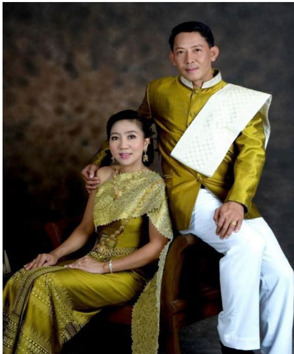
(ຮູບ ການແຕ່ງກາຍຂອງຄົນໄທ)

- ການແຕ່ງຕົວຂອງໄທ ແມ່ນແຕກຕ່າງກັນໄປຕາມພາກຕ່າງໆຂອງໄທ ເຊັ່ນ ພາກເໜືອ, ພາກກາງ, ພາກຕາເວັນອອກສ່ຽງເໜືອ ຫຼື ຕ່າງກັນໄປຕາມແຂວງເຊັ່ນ ຊຽງໃໝ່, ອີ່ສານ...ຂອງໄທ ມີປະເພນີການແຕ່ງກາຍຕ່າງກັນ.