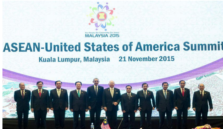
ຝັ່ງການທີ່ບໍ່ກ່ຽວຂ້ອງກັບສາສະໜາ

ຜູ້ເຖົ້າຜູ້ທີ່ມີອາຍຸໄວກາງຄົນນຸ່ງສິ້ນຝ້າຍ, ສິ້ນໄໝ, ມີຫົວ ມີຕີນ, ນຸ່ງເສື້ອແຂນຍາວ ຫຼື ເສື້ອແຂນສັ້ນ ເສື້ອສີຕ່າງໆ ຫຼື ນຸ່ງເຄື່ອງແບບທາງລັດຖະການ.