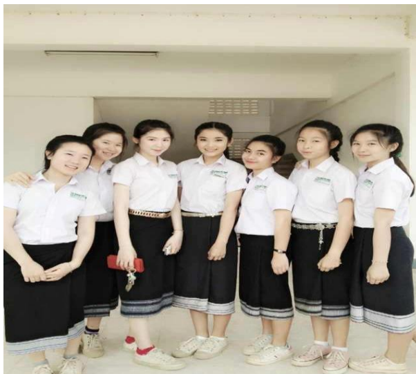
(ຮູບ ການນຸ່ງຫົ່ມຂອງນັກຮຽນຊັ້ນມັດທະຍົມ)