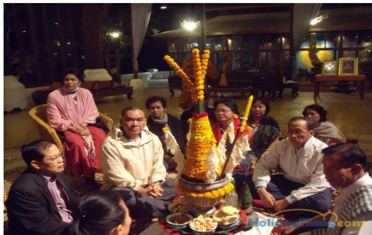
(ຮູບ ການນຸ່ງຫົ່ມພິທີທາງສາສະໜາ)

ງານນີ້ ມີພິທີສຸຂວັນ, ບຸນປີໃໝ່, ບຸນຊ່ວງເຮືອ, ທອດກະຖິນ, ເຮັດບຸນສິນກິນທານ ແລະ ອື່ນໆ ການແຕ່ງຕົວແມ່ນນຸ່ງຜ້າກ່ອມ ຫຼື ນຸ່ງໂສ້ງຂາຍາວສີດຳ ຫຼື ສີຝ້າ, ເສື້ອແຂນສິ້ນ, ແຂນຖ່ອງ ຫຼື ໃສ່ຊຸດ ສາກິນ (ຊຸດແວັດ) ໃສ່ເກີບໂອຊິກ ຫຼື ເກີບສຸບ, ໃສ່ແພປ່ຽງບ້າຍ ຫຼື ບາງພິທີທີ່ສຳຄັນທາງລັດຖະກອນ ເຊັ່ນ ທະຫານ, ຕຳຫຼວດ, ຕ້ອງຕິດຫຼຽນກຽດຕິຍົດ, ຫຼຽນໄຊ, ຫຼຽນກາຕ່າງໆ.