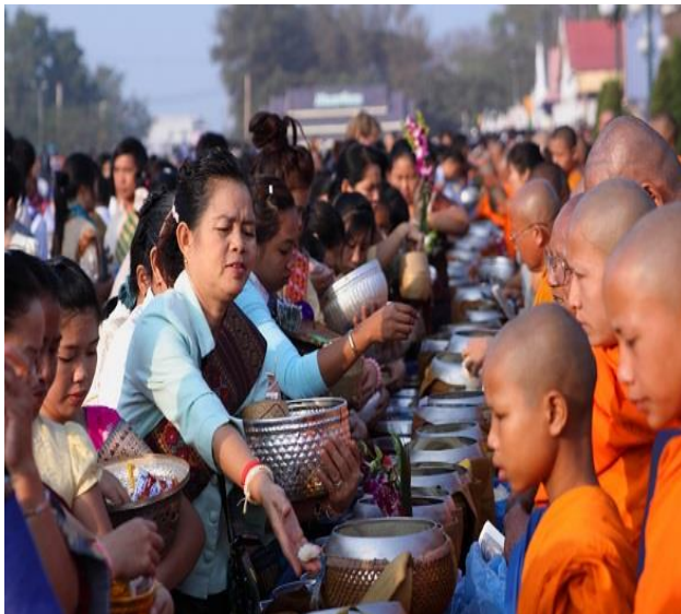
(ຮູບພາບ ວິທີກິດຈະກຳຢູ່ເດີນພະທາດຫຼວງວຽງຈັນ)