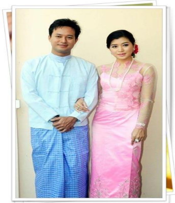
(ຮູບ ການແຕ່ງກາຍຂອງຊາວມຽນມາ)

ເຄື່ອງນຸ່ງຜ້ານັ້ນຂອງມຽນມາເອີ້ນວ່າ ລອງຍີ (Longgi) ຜ້າສະໄຫຼ່ງເປັນເຄື່ອງນຸ່ງສໍາລັບຊາຍ ແລະ ຍິງ. ຕາມປະເພນີແລ້ວ ເພດຊາຍນຸ່ງເສື້ອແຈັກເກັດບໍ່ມີຄໍ ປົກຄຸມດ້ວຍເສື້ອເຊີດແຂນສັ້ນສີຂາວ, ເພດ ຍິງນຸ່ງຜ້າຄຸມປ່າ ແລະ ເສື້ອຜູ້ຍິງທໍາມະດາ.