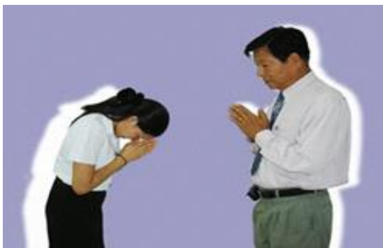
ຮູບພາບການໄຫ້ວຜູ້ອາຈຸໂສ